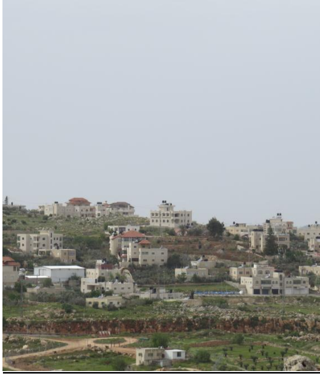
בתי היישוב עופרה