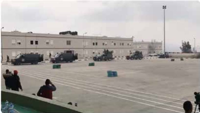
وحدة العمليات الخاصة الفلسطينية ال 101