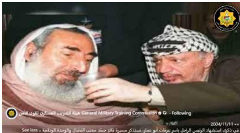
איור 8 - יאסין וערפאת, מתוך הסרון בעמוד הפייסבוק של אגף ההכשרה הצבאית.

ותישאר במצב של "רבאט" (הגנה ומאבק מתמידים) עד יום הדין. חדית' זה, משקף אמונה דתית בניצחון האסלאמי דרך ירושלים; אמונה שרבים ראו בטבח השבעה באוקטובר את תחילת התגשמותה. 49 אחריו נוספו בסרטון דבריו של ערפאת על שעב אלג'בארין (עם הגיבורים) המגן על המקומות הקדושים לאסלאם ולנצרות ועל "אדמת הערביות", מהאוקיינוס ועד המפרץ.