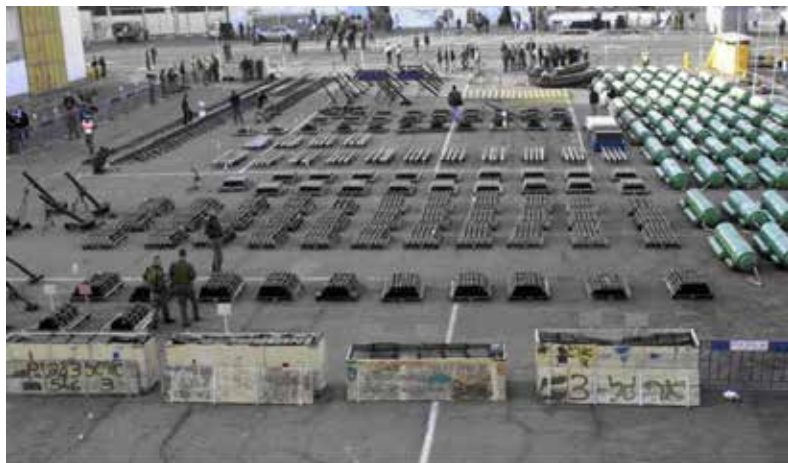
איור 2- אוניית הנשק קארין A והנשק הרב שהוכרח עליה.

את רציחתם באכזריות. האירוע הסתיים רק לאחר שהגופות המושחתות הושלכו לידי כוחות צה"ל, והפך לאחד מסמלי השבר של האמון במנגנוני הביטחון הפלסטיניים.