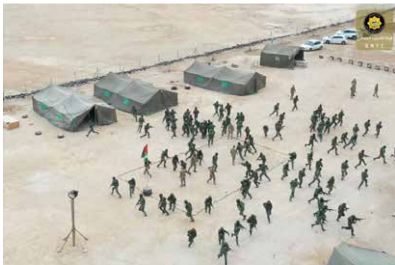
איור 5- אימוני חי"ר.

תהליך שדרוג הקטלניות של המנגנונים הפלסטיניים נשען על מעטפת ארגונית ולוגיסטית הדוקה מצד המערב, ובמרכזה המשלחות הקנדית והאמריקאית (USSC). במרכז הבינלאומי לאימון משטרה ליד עמאן, עוברים גדודי הביטחון הלאומי (NSF) סדרות אימונים טקטיות בפיקוח אמריקאי, הכוללות שימוש בנשק חם. 39 מעטפת זו מעניקה למנגנונים את הלגיטימציה הבינלאומית הנדרשת, המהווה 'אור ירוק' להמשך בניין הכוח הרחק מהעין הציבורית.