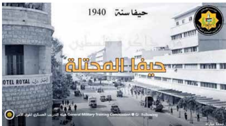
איור 9 - דרישת שלום לעיר "הכבושה" חיפה, מתוך סרטון בעמוד הפייסבוק של אגף ההכשרה הצבאית.

הצבאי של המנגנונים האימונים הצבאיים מקבלים שמות סמליים שאינם מותירים מקום לספק לגבי הכוונות האסטרטגיות, דוגמת התרגיל המקיף "גדר נהר הירדן" 52 . רטוריקה זו, המלווה את כל מערך ההכשרה, מדגישה באופן עקבי כי ייעודו של הכוח אינו שמירה על הסדר הציבורי בלבד, אלא תפקוד כראש חץ במאבק ל"עצמאות העם הפלסטיני" תוך הכשרת הלבבות לתרחישי "היפוך קנים" ועימות ישיר עם מדינת ישראל.