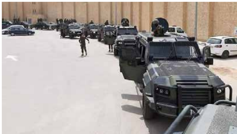
איור 4 - שיירת משוריינים.

שוטרים ביחס לכמות אוכלוסייה בישראל: בעוד שבמדינת ישראל משרתים כ-3 שוטרים לכל אלף נפש, ברשות הפלסטינית הנתון מזנק לבין 13 ל-24 שוטרים לכל אלף איש. כך שאפילו ההערכות השמרניות ביותר מדברות על פער של כ-פי 4 מסד"כ של משטרת ישראל. ההשוואה מראה באופן פשוט שלא מדובר בכוח שיטורי, אלא בצבא לכל דבר ועניין.