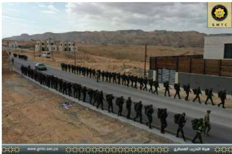
איור 6 - הכשרת כוחות יבשה.