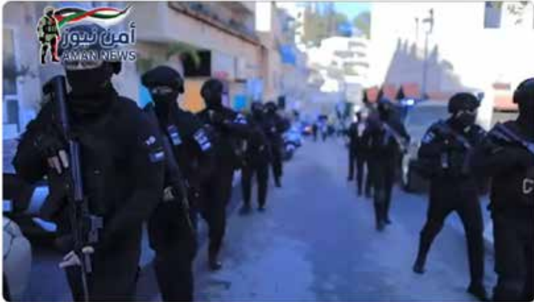
היחידה الخاصة في جهاز الشرطة الفلسطينية فريق SAT للعمليات الخاصة