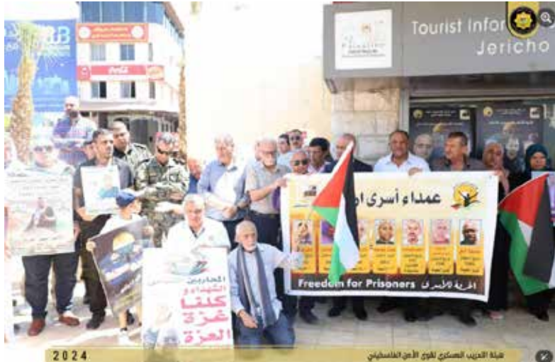
איור 7 - שלטי "חופש לאסירים", המאדירים מחבלים שביצעו פיגועים רצחניים, בהם הפיגוע בקו 961 בשנת 1988 והפיגוע בנחל פרת בשנת 1997.

האסיר הפלסטיני (18.4.2018), הדגיש ראש האגף, לואא (אלוף) יוסף אלחלו, כי התמיכה באסירים בבתי הכלא של "הכיבוש" היא חובה לאומית ודתית המצויה בראש מעייניה של ההנהגה הפלסטינית. במהלך הטקס, שנפתח בקריאת הפאתחה לעילוי נשמות השהידים, הוענקו אותות הוקרה לקבוצת אסירים משוחררים ששירתו או משרתים בפועל כקצינים במנגנוני הביטחון, פעילי טרור שהכווינו פיגועים וריצו תקופות מאסר ממושכות. אירוע זה מבליט את הזיקה העמוקה והגיבוי המוסדי שמעניקה בראש ובראשונה הרשות הפלסטינית ותחתיה, מערך ההכשרה הצבאית של הרש"פ לאסירים ביטחוניים, תוך שילובם בדרגות פיקוד בכירות בתוך המנגנונים.